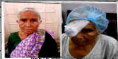
Paste Photos Here Pre Post